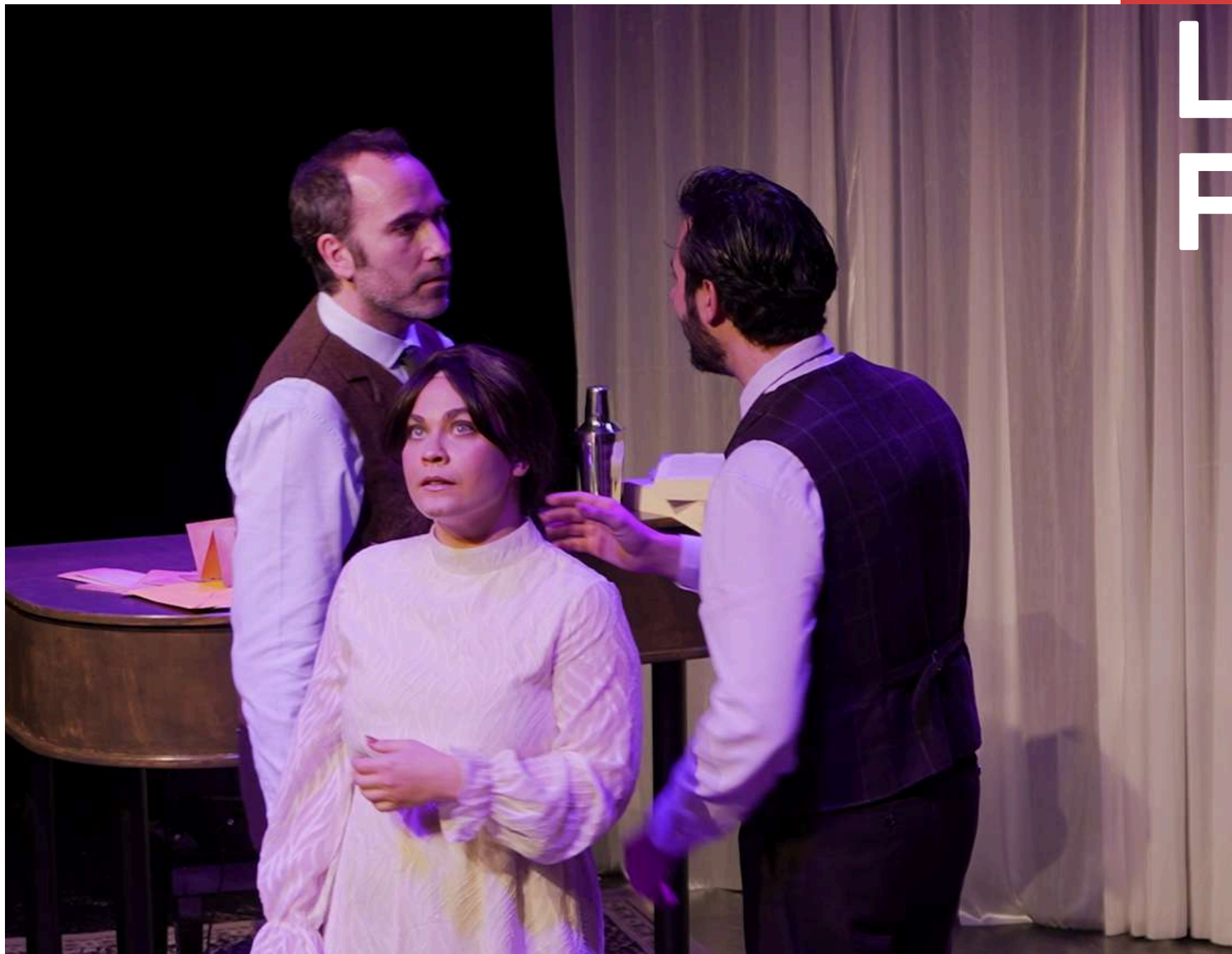
Fotografías de La Kimera Teatro